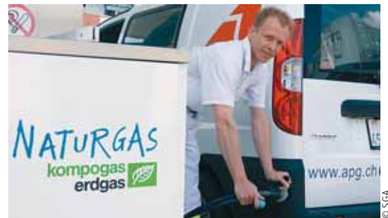
La SGA dispose de la plus grande flotte de véhicules au gaz de toute la Suisse.

Ces mesures ont permis à la SGA, qui emploie environ 500 collaborateurs et collaboratrices dans toute la Suisse, de réduire largement ses émissions de gaz à effet de serre. Par rapport à 2003, la baisse est de 16%, soit 750 tonnes de CO 2 : 38% sont dus à la politique de mobilité, 32% à l'énergie de chauffage choisie, et 22% à l'achat d'électricité propre. La baisse dépasse de loin les objectifs fixés par la SGA en accord avec l'Agence de l'énergie pour l'économie (AEnEC) (voir graphique). Economiquement aussi, ces efforts ont payé: malgré la hausse des prix, les dépenses de carburant de la SGA ont baissé de 10% depuis 2000. Sa politique environnementale lui permet d'économiser des centaines de milliers de francs par an.